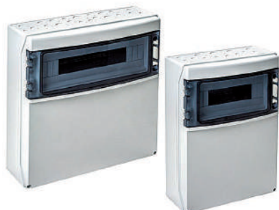
COFFRET ABS IP65 - IK08