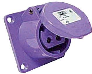
Prise 24 V