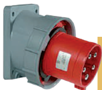
IP IP44 IP67