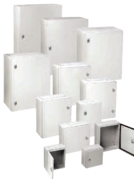
COFFRET POLYESTER IP66 - IK10